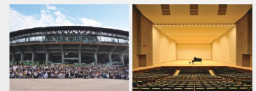
レクザムスタジアム(香川県宮野球場)