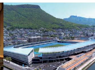
屋島レクザムフィールド (高松市屋島競技場)