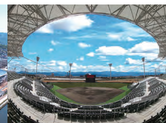
レクザム ボールパーク丸亀 (丸亀市民球場)